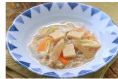
こうや豆腐と豚肉の塩煮