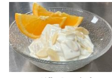
デザートにも! 高野豆腐と牛乳のデザート