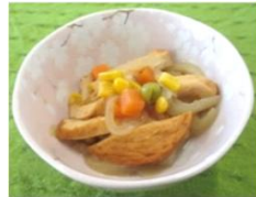
(調理例) さつま揚げと野菜の煮物